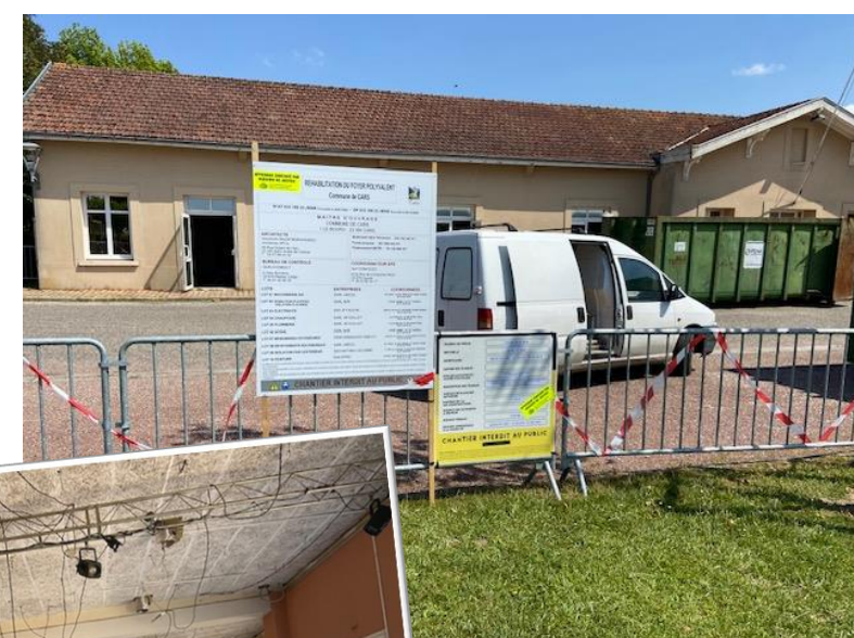
Les travaux du foyer