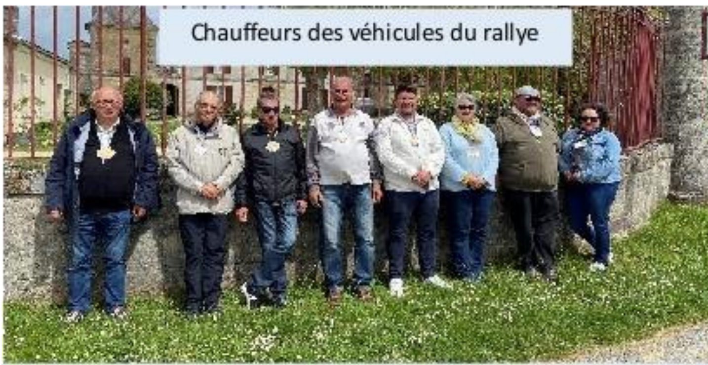
Chauffeurs des véhicules du rallye