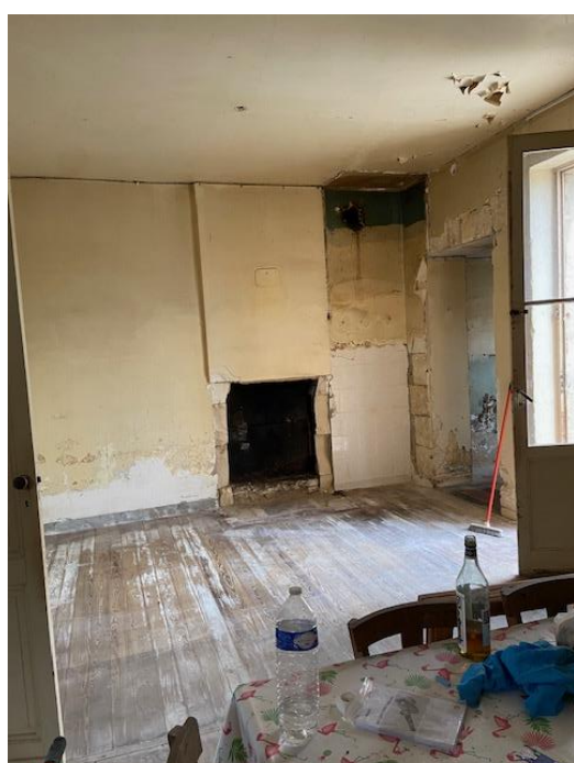
Les travaux de la future MAM